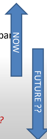
Konferencija Udruge poslodavaca u zdravstvu Hrvatske, „Proljeće 2018.“ Opatija, 22. svibnja 2018. godine