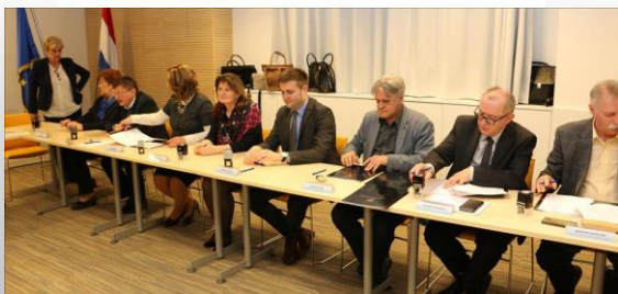
Konferencija Udruge poslodavaca u zdravstvu Hrvatske, „Proljeće 2018.“ Opatija, 22. svibnja 2018. godine